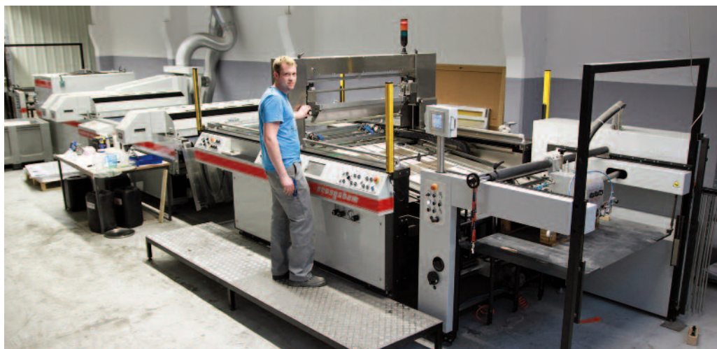
Mit einer großformatigen Siebdruckmaschine – ausgestattet mit zwei UV- und einem IR-Trockner – lackiert V4 Veredelung die unterschiedlichsten Materialien und Formate in höchster Qualität.